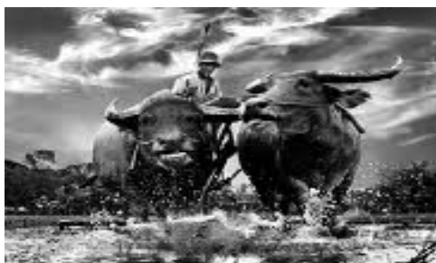
Cúng Tổ Ngành Nông nghiệp