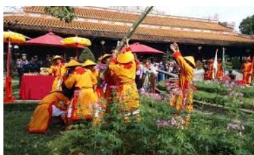
Lễ Hạ Nêu