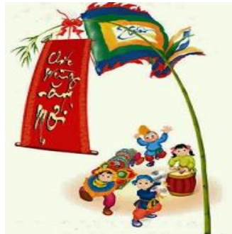
Lễ Hạ Nêu