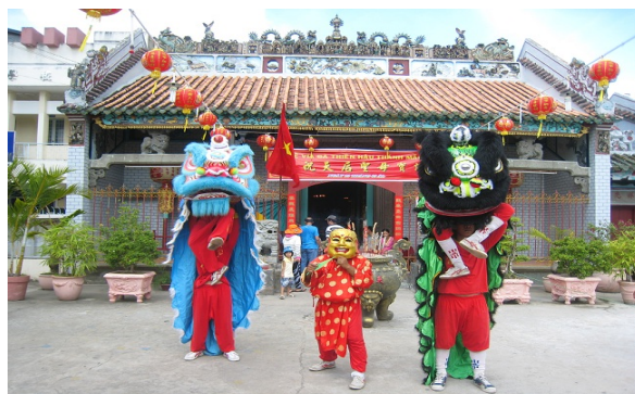
Lễ Viá bà